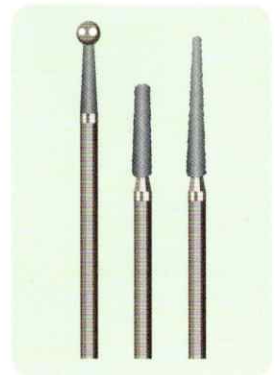
歯を削るドリルを 患者様ごとに滅菌