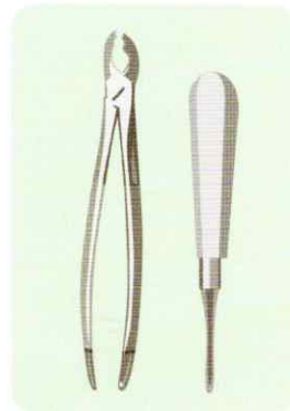
外科器具を 患者様ごとに滅菌