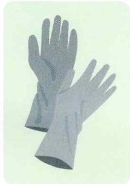
グローブを 患者様ごとに交換

患者様に安心して治療を受けていただくために、当院では患者様ごとに主に以下の感染対策を実施しております。